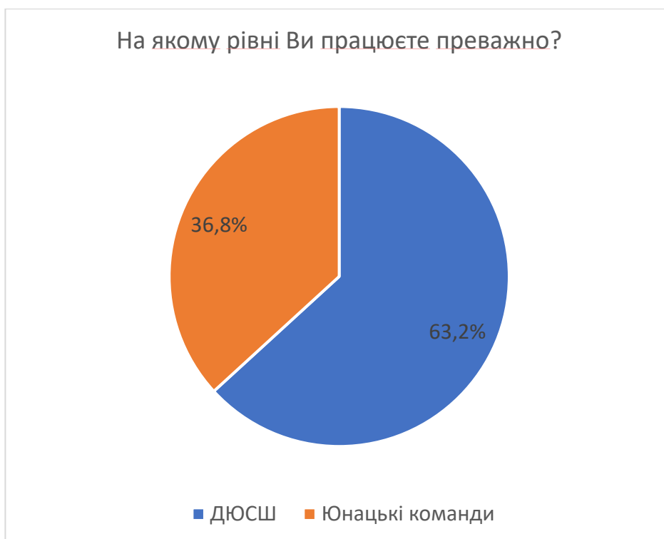
Рис 4.2 Місце роботи тренерського персоналу (респондентів)

Найбільш реалістичними джерелами фінансування для відновлення спортивних об'єктів в Україні на думку експертів є приватні інвестори (84,2%), УЄФА та ФІФА (54,6%), державний бюджет (47,4%) та благодійні фонди (47,4%) (рис. 4.3)