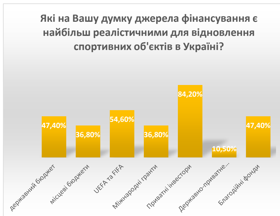
Рис 4.3 Джерела фінансування для відновлення спортивної інфраструктури

Найбільш реалістичними джерелами фінансування для відновлення спортивних об'єктів в Україні на думку експертів є приватні інвестори (84,2%), УЄФА та ФІФА (54,6%), державний бюджет (47,4%) та благодійні фонди (47,4%) (рис. 4.3)