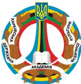
Харківська державна академія фізичної культури