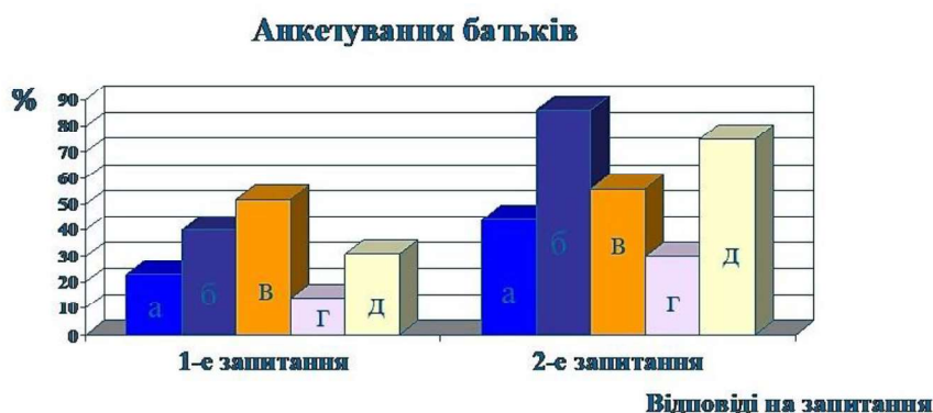
Рис. 1. Результати анкетування батьків

На основі узагальнення відповідей респондентів на питання анкети «Що, на Вашу думку є головним у роботі тренера?» встановлено, що досвід роботи (86 %) та ставлення до вихованців (75 %) (тренер виконує функцію вихователя) – основа роботи тренера.