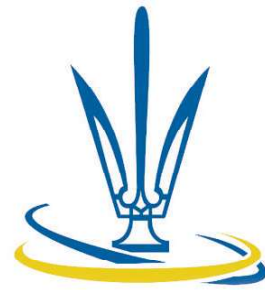
Спортивний комітет України