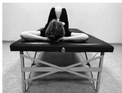
Вихідне положення – лежачи на спині, ноги зігнуті в колінних суглобах. Зафіксувати м'яч між колінами, звести коліна, стискаючи м'яч (4–6 разів). Потім розслабитися. Повторити вправу (по 5–6 разів)