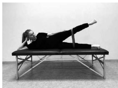
Вихідне положення – лежачи на боці, відведення ноги зі спротивом, утримати положення 2–5 с. і повернутися в положення лежачи. Вправу виконувати плавно, з невеликою амплітудою, не викликаючи болю. Повторити вправу іншою ногою (по 5–6 разів)