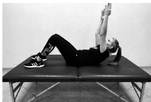
Вихідне положення – лежачи на спині, руки витягнуті вперед, ноги зігнуті в колінних суглобах, стопи на кушетці. Плавню підняти верхню частину тулуба, включаючи лопатки, витягаючись вгору за руками, утримати положення 2–5 с. і повернутися в положення лежачи. Вправу виконувати плавно, з невеликою амплітудою, не викликаючи болю. Повторити вправу (по 5–6 разів)