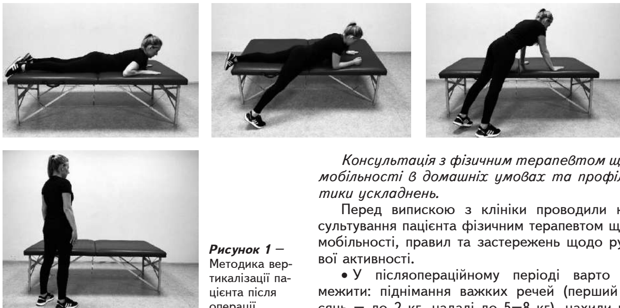
Рисунок 1 – Методика вертикалізації пацієнта після операції

зміцнення м'язів живота не допускались протягом 6 тиж. Плавання і біг дозволяли через 8 тиж.