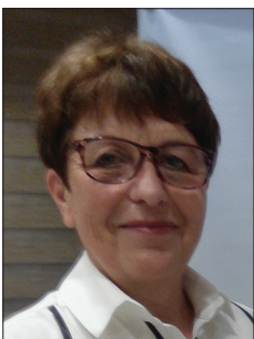
О. В. БЕХ Заслужений працівник фізичної культури і спорту України, Національний суддя зі спорту з легкої атлетики, президент Федерації легкої атлетики Вінницької області