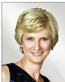
О. А. ШИНКАРУК Доктор наук з фізичного виховання та спорту, професор, Заслужений працівник фізичної культури і спорту України, член-кореспондент Української академії наук, завідувач кафедри кіберспорту та інформаційних технологій Національного університету фізичного виховання і спорту України