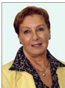
Л. Я.-Г. ШАХЛІНА Доктор медичних наук, професор, майстер спорту СРСР зі спортивної гімнастики, Заслужений діяч науки і техніки України, завідувач (2002–2014 рр.), професор кафедри спортивної медицини Національного університету фізичного виховання і спорту України