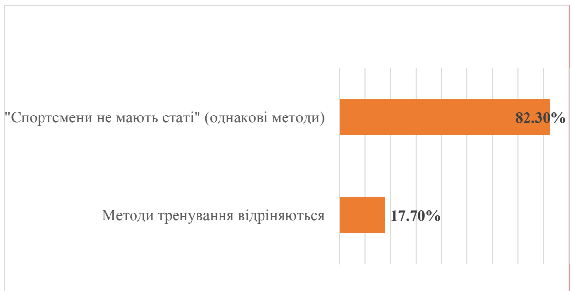
Рисунок 4.2 – Думка тренерів щодо відмінностей у методиці підготовки чоловіків і жінок

Наступний блок питань стосувався методичних аспектів підготовки. Більшість тренерів (82,3%) переконані, що підходи до тренувань чоловіків і жінок мають кардинально відрізнятися (рис. 4.2).