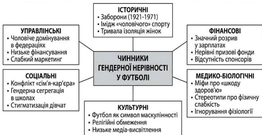
Рис. 4.4. - Класифікація чинників нерівності у футболі

Для наочного відображення взаємозв'язку описаних проблем було систематизовано основні групи факторів впливу (рис. 4.4).