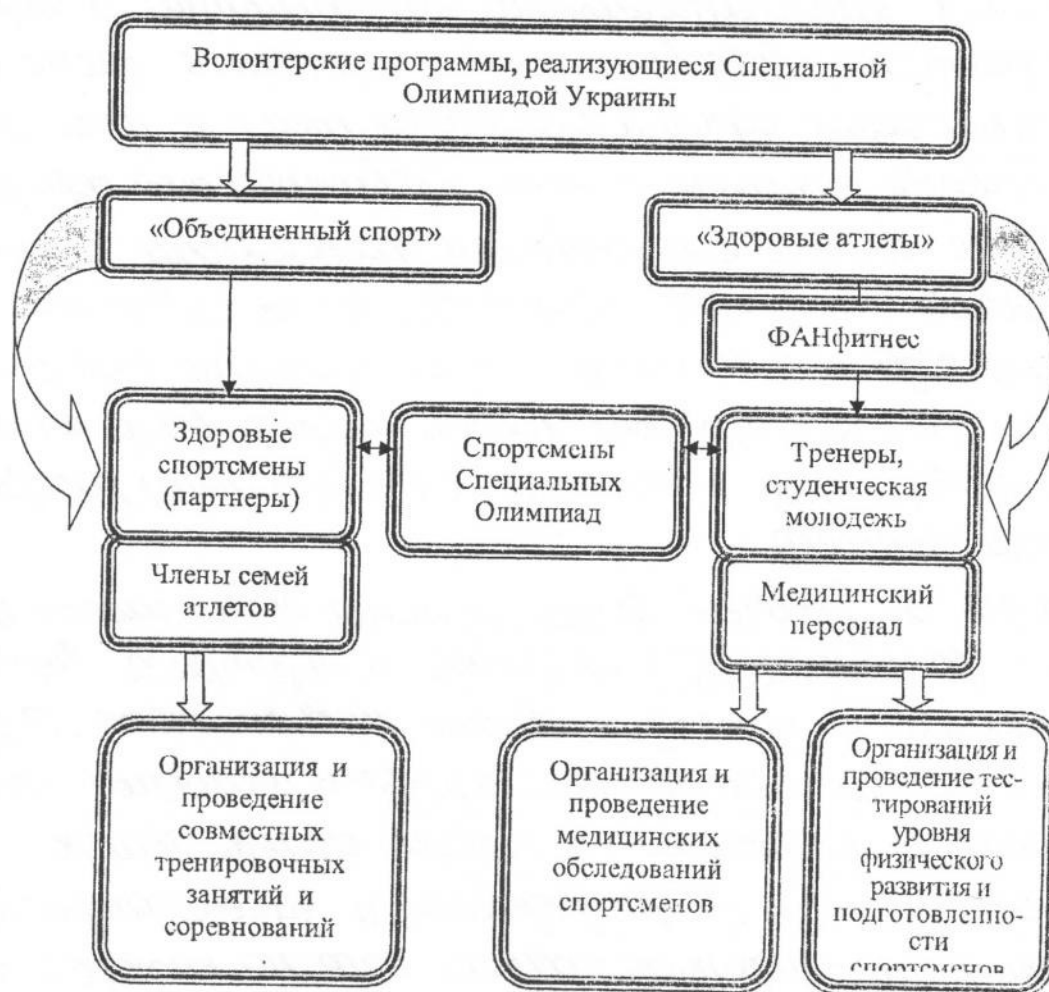
Рисунок 1 - Волонтерские программы, реализуемые Специальной Олимпиадой Украины

Однако, в Украине на сегодняшний день реализуются две волонтерские программы Специальных Олимпиад: «Объединенный спорт» и «ФАНфитнес» (как составная часть программы «Здоровые атлеты»). В рамках данных волонтерских программ добровольцы занимаются организацией тренировочных занятий и соревнований для спортсменов Специальной Олимпиады, а так же участвуют в специально организованной диагностике уровня физического развития, физической подготовленности, уровня здоровья спецолимпийцев и т.д. (рисунок 1).