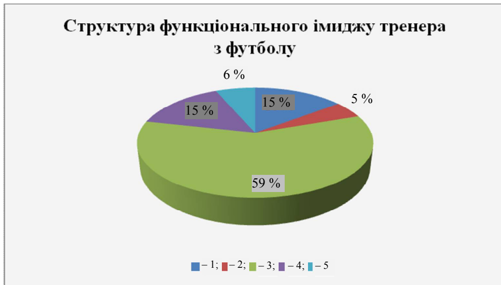
Рис. 1. Структура функціонального іміджу тренера з футболу

Примітка. 1 – характеристики, що відображають узагальнене поняття про статус та професійну освіту; 2 – характеристики, що відображають сприйняття зовнішності; 3 – індивідуально-психологічні якості та характеристики, що забезпечують ефективність тренерської діяльності; 4 – характеристики, що відображають особливості поведінки та взаємодії; 5 – спеціальні знання та вміння.