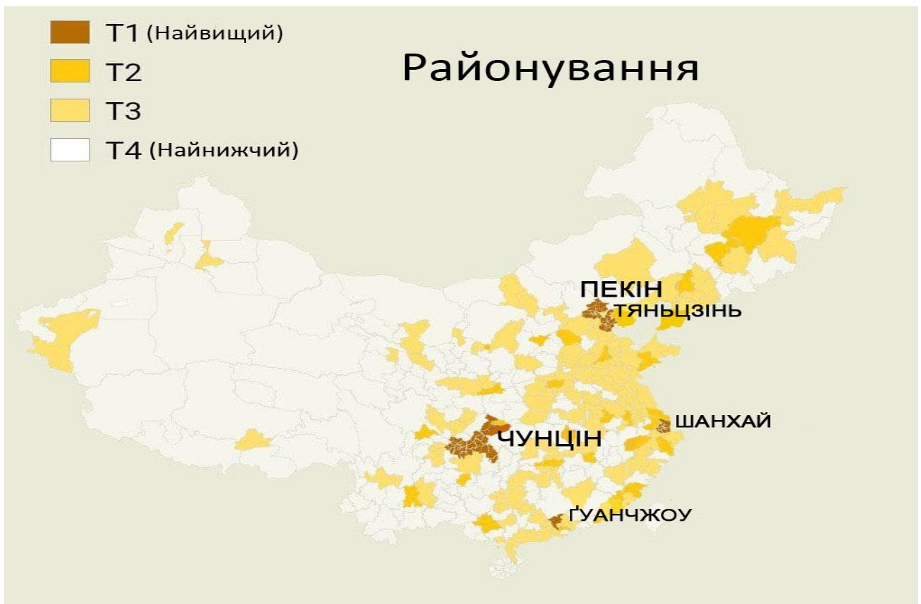
Рис 2.2. Районування міст за фактичним рівнем. Джерело: [21].

Багато міст класифікуються по-різному в кожній області, тому середнє значення використовується для визначення їх фактичного рівня. Місто з рейтингом 1-2-1 буде в першому рівні (рис 2.2).