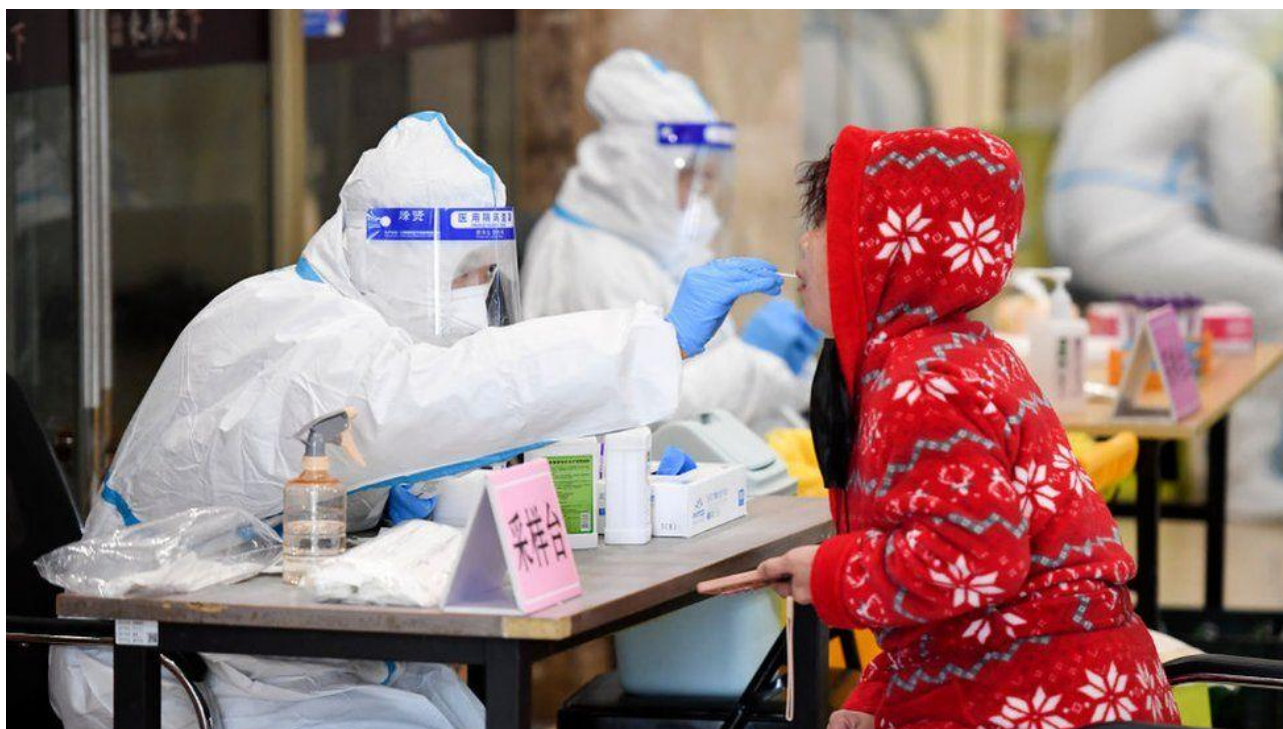
Рис. В.1. Тестування на вулицях Шанхаю в рамках політики «ZeroCovid».