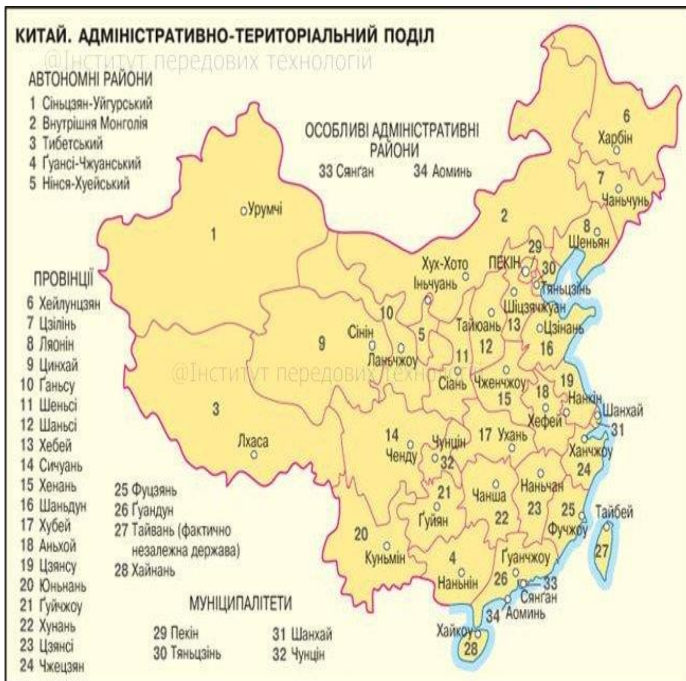
Рис. А.1. Картографічні дані Китаю.