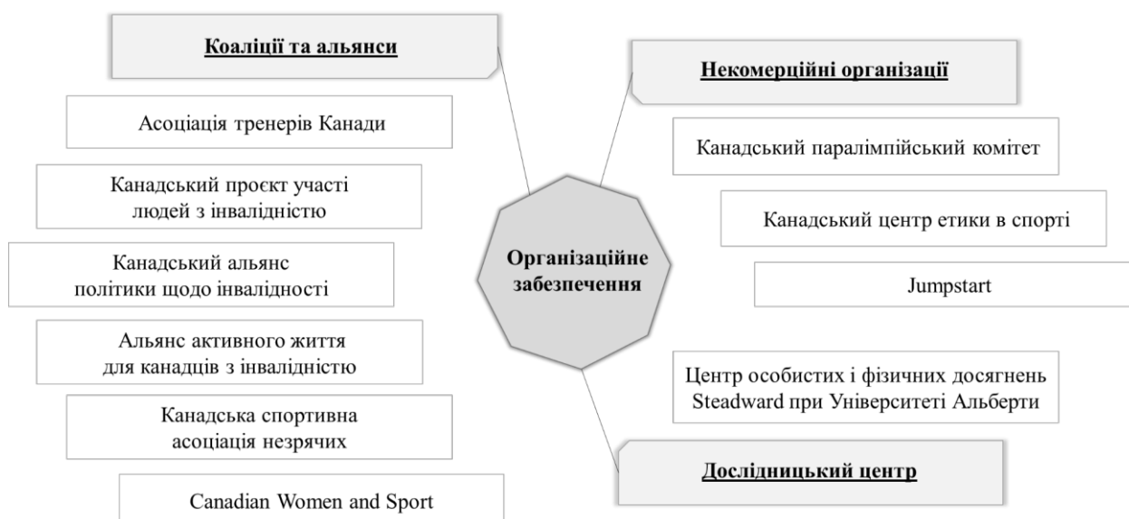
Рис. 1. Досвід Канади в організаційному забезпеченні інклюзивності в спорті

Методичне забезпечення інклюзивності в спорті Канади має також свої особливості. Використання методу індукції в попередньому дослідженні методичного забезпечення інклюзивності в спорті [2] дозволило охарактеризувати його на основі значної кількості ресурсів та матеріалів з урахуванням їх характеристик, рівнів та підходів до його формування та вдосконалення. Використовуючи метод дедукції, тобто застосовуючи ці узагальнені висновки до конкретного контексту, здійснено його зіставлення із загальною структурою методичного забезпечення. Навчально- (посібники, керівні принципи, навчальні модулі й курси) та інструктивно-методичні ресурси (практичні інструкції та рекомендації, інструменти планування і шаблони) є найбільш репрезентативними категоріями. При цьому в ході дослідження було помічено, що значна кількість методичних ресурсів заснована на окремих наукових дослідженнях, акумулюючи в собі кращі інклюзивні стратегії та рішення. Відсутність серед дослідженого методичного оснащення програмно-методичних матеріалів пояснюється національною спортивною політикою Канади, згідно з якою всі спортивні програми мають бути інклюзивними. Можна припустити, що інклюзивність у спорті Канади вважається нормою і, можливо, приводить до меншого акценту на розроблення окремих методичних ресурсів, оскільки інклю-