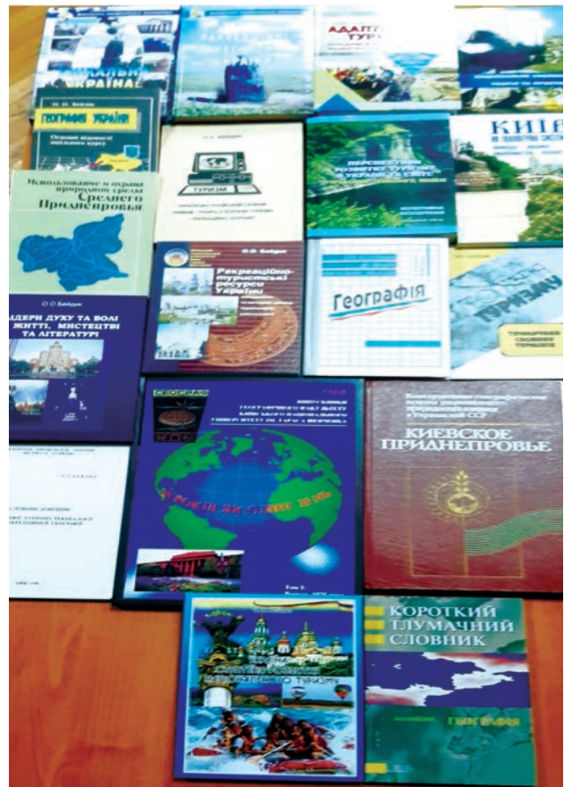
Науковий доробок професора О. О. Бейдика.

У 2005 р. він захистив докторську дисертацію на тему «Методологія та методика аналізу рекреаційно-туристських ресурсів України», метою якої є розвиток методології рекреаційної географії та географії туризму, що полягає в систематизації уявлень про просторові рекреаційно-туристичні ресурси, розширенні та поглибленні поняттєво-термінологічного апарату рекреаційної географії, розробці методики аналізу рекреаційно-туристичних ресурсів території України з виходом на її ресурсно-рекреаційне