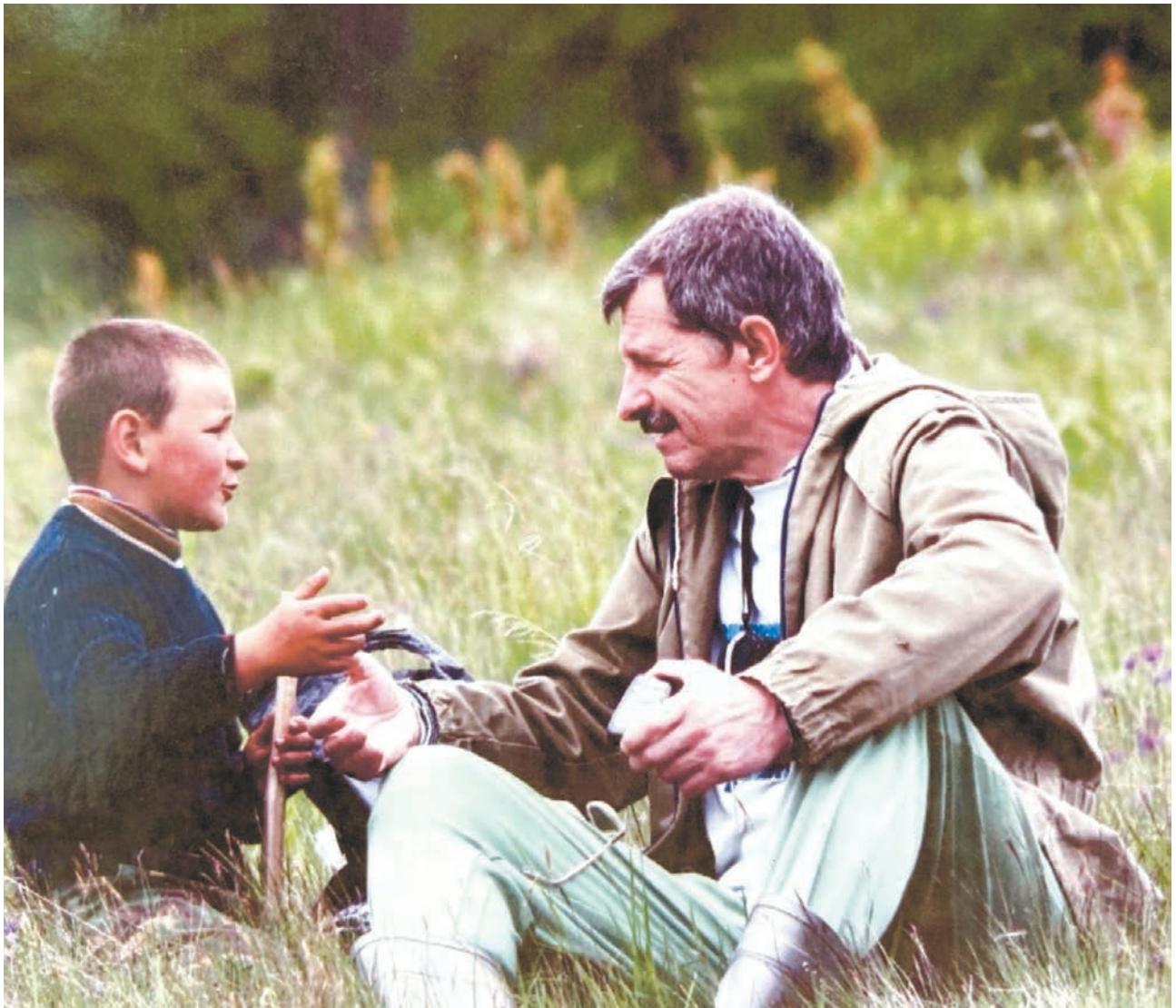
Спілкування з юним краєзнавцем на туристичних стежках Карпат