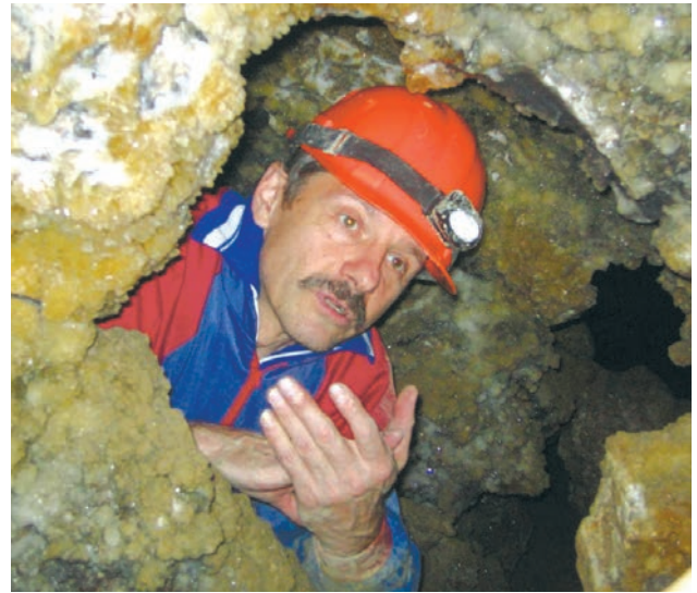
У печері Атлантида

У цілому, науковий набуток О.О. Бейдика складає майже 500 праць (підручників, навчальних посібників, монографій, статей), підготовлених самостійно або у співавторстві. Серед