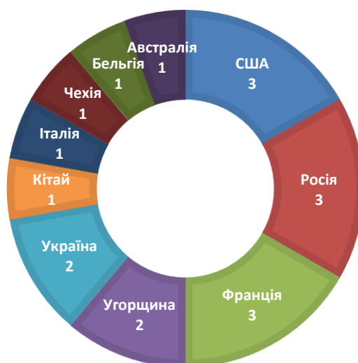
Рисунок 1. Співвідношення кількості призових місць, зайнятих національними жіночими збірними командами у чемпіонатах світу з баскетболу 3x3

Порівняльний аналіз досягнень на чемпіонатах світу з баскетболу 3x3 серед національних жіночих збірних команд з 2012 року свідчить, що у шести чемпіонатах світу призерами ставали команди 10 країн, з них три, а саме США, Росії та Франції ставали тричі призерами, команди Угорщини та України двічі, і інші команди п'яти країн по одному разу (рис. 1) [20].