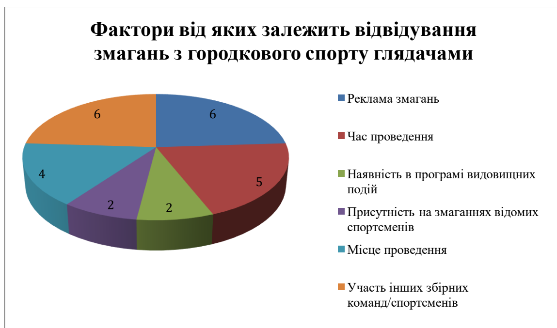
Рис. 4.3 Анкетування стосовно факторів, від яких залежить відвідування змагань з городкового спорту глядачами

За результатами опитування можна зробити висновок, що думки респондентів розійшлись, найсуттєвішими факторами від яких залежить відвідування змагань з городкового спорту глядачами, на думку експертів, є реклама змагань та участь інших збірних команд/спортсменів.