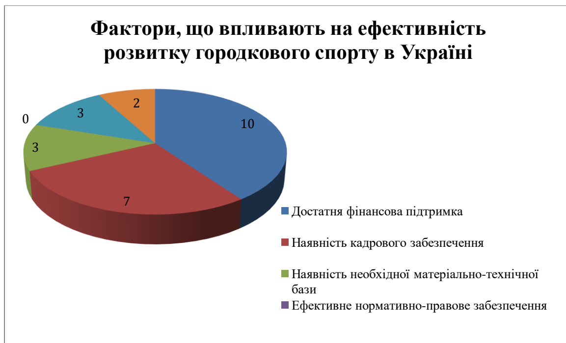
Рис. 4.2 Анкетування стосовно факторів, що впливають на ефективність розвитку городкового спорту в Україні як неолімпійського виду спорту

Другим питанням було визначення факторів, від яких залежить відвідування змагань з городкового спорту глядачами (на думку респондентів). Респонденти голосували за такі фактори: реклама змагань, час проведення, наявність в програмі видовищних подій, присутність на змаганнях відомих спортсменів, місце проведення, участь інших збірних команд/спортсменів. Респонденти проголосували таким чином: