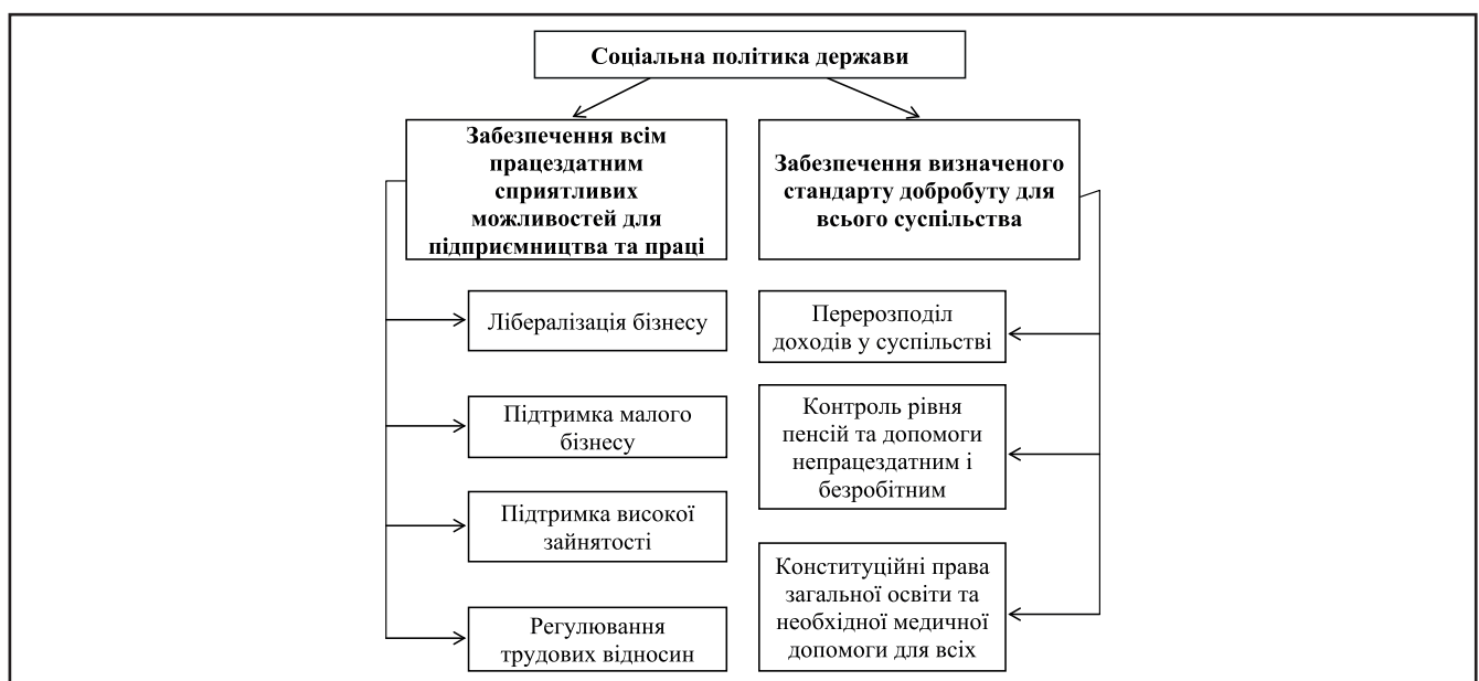
Рисунок 2. Головні складові соціальної політики держави

Для розробки нормативів споживання товарів та платних послуг застосовуються такі методи. Нормативний – пе-