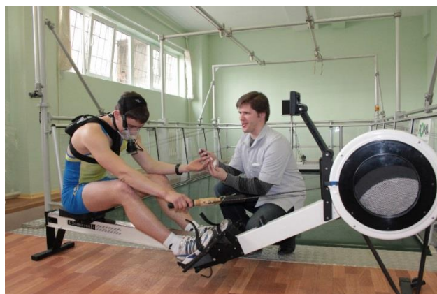
Рис. 15.3. Дослідження функціональних можливостей спортсменів в звичайних умовах тренування (лижний стадіон) та в лабораторних умовах (веслування на ергометрі).