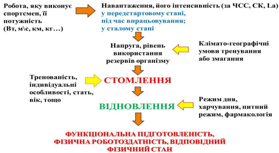
Рис. 15.1. Методологічні основи дослідження функціональної підготовленості спортсменів: Рудими стрілками показана послідовність станів, що виникають в організмі спортсмена під впливом фізичних навантажень; жовтими стрілками – додаткові фактори, які мають вплив на окремі стани.