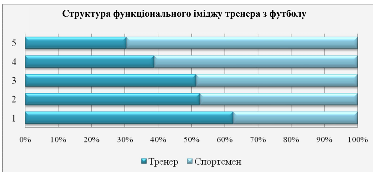
Рис. 4. Структура функціонального іміджу тренера з футболу в розрізі груп «Тренер» та «Спортсмен»

Також для спортсменів (70 %) позитивний імідж тренера залежить від спеціальних знань і вмінь тренера, на відміну від тренерів, які цій характеристиці надають найменше значення у формуванні успішного іміджу (30 %).