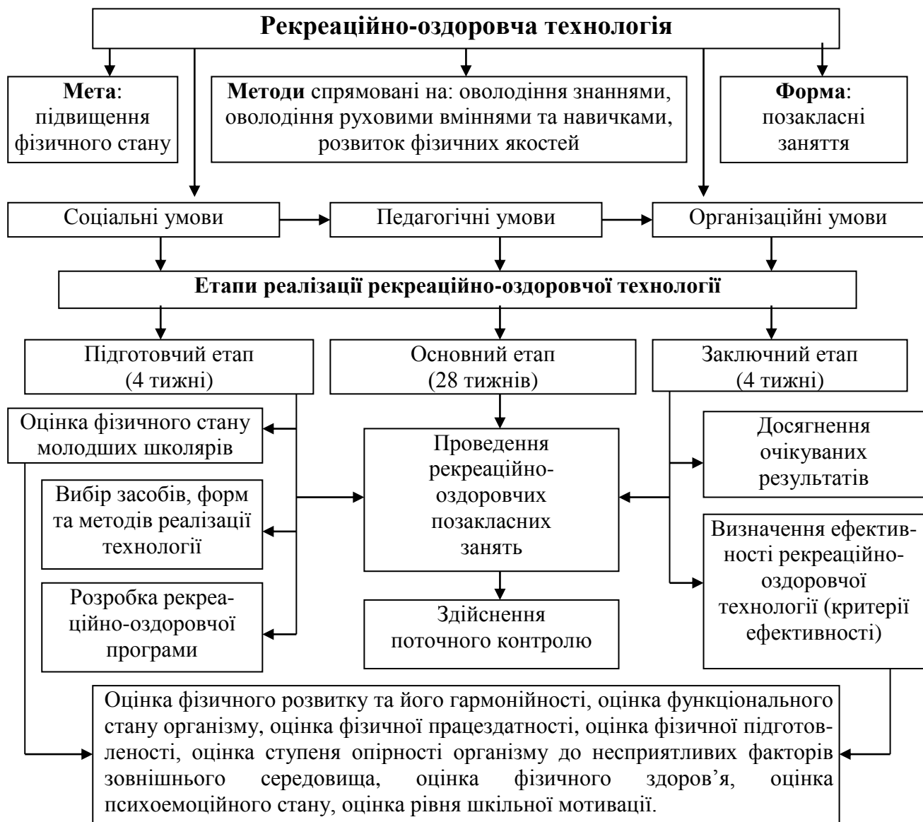
Рис. 1. Блок-схема структури реалізації рекреаційно-оздоровчої технології

Реалізація рекреаційно-оздоровчої технології проходила в три етапи (рис. 1):