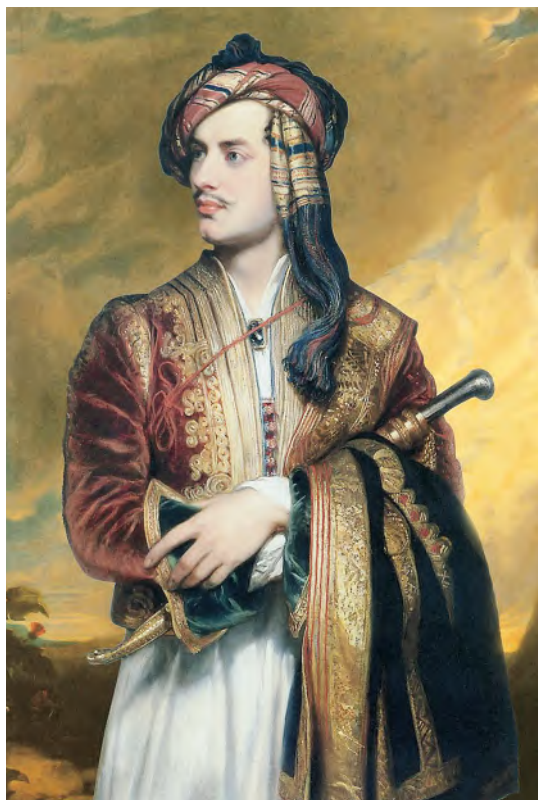
РИСУНОК 11 – Портрет лорда Байрона. Филипп Томас. Лондон, Национальная портретная галерея

К числу наиболее значительных трудов по истории древнего мира относится и произведение известного немецкого археолога, топографа и историка Эрнста