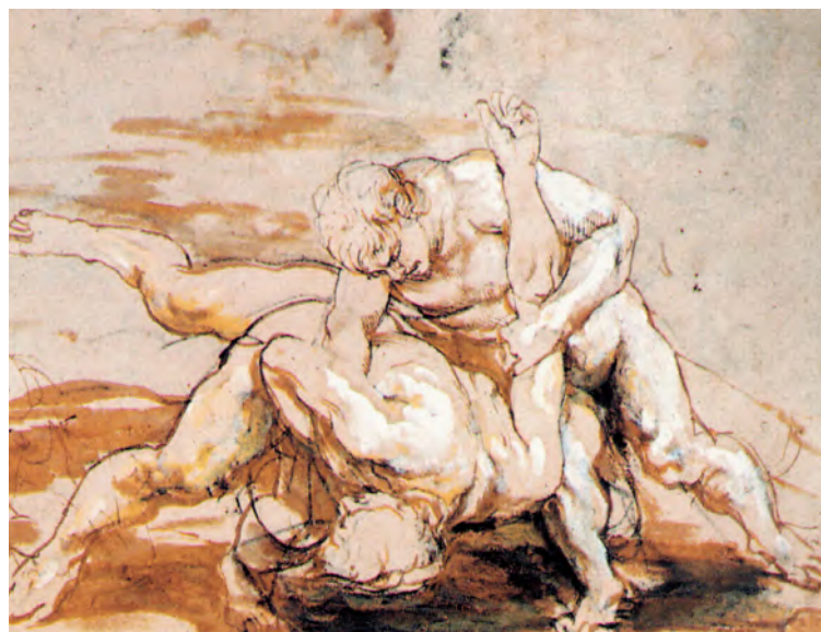
РИСУНОК 13 – Борящиеся панкратионисты. Питер Пауль Рубенс, XVII в.

Своим творческим достижением известный художник из Женевы Жан-Пьер Сен-Урс считал полотно «Олимпийские игры». Эта картина, работу над которой он начал в 1785 г., определила все его последующее творчество. Сен-Урс быстро стал востребованным и был