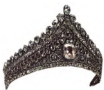
РИСУНОК 16 – Бриллиантовая диадема императрицы Елизаветы Алексеевны. Москва, Алмазный фонд