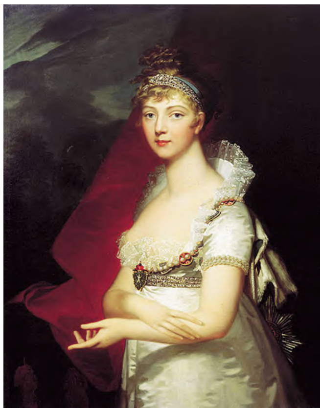
РИСУНОК 17 – Портрет императрицы Елизаветы Алексеевны. Монье Жан-Лоран. 1807 г.

высоко оценен, его лучшие полотна демонстрировались на выставках в Париже, приобретались известными людьми во Франции. В начале 1790-х годов художник создал великолепную работу – «99-я Олимпиада», на которой представлен финал схватки борцов, когда судьи готовы объявить победителя. На картине запечатлено большое количество персонажей, относящихся к различным слоям общества, но объединенных идеей Олимпийских игр и общей атмосферой спортивного праздника.