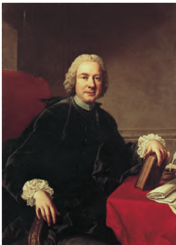
РИСУНОК 12 – Пьетро Метастазιο – видный итальянский поэт и драматург-либреттист

Одним из ярчайших проявлений такого интереса стало либретто «Олимпиада» Пьетро Метастазιο (1698–1782 гг.) – видного итальянского поэта-либреттиста, представителя Неаполитанской оперы, слава которой гремела в Западной Европе в течение всего XVIII в. (рис. 12). Сцена – Олимпия на берегу Алфея. Содержание – атмосфера олимпийского праздника с религиозными ритуалами, состязаниями атлетов, волнением зрителей, чувством победителей. Дух – благородное рыцарство, восхваление патриотизма, сыновней любви и человеческой дружбы, достоинства и чувства чести, равновесие физического и духовного, значение атлетики и атлетов для общества, благородные страсти и высокие идеалы.