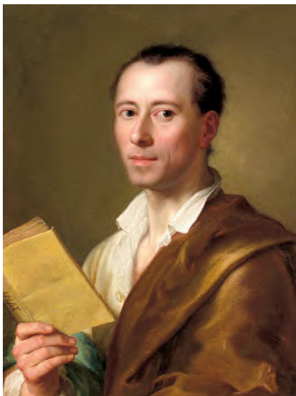
РИСУНОК 6 – Иоганн Винкельман – немецкий искусствовед, основоположник существующих в то время представлений об античном искусстве, науке, археологии. Менгс Рафаэль. Прибл. 1777 г. Нью-Йорк, Метрополитен-музей