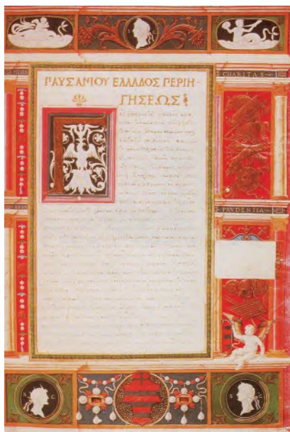
РИСУНОК 9 – Фронтиспис издания «Описание Эллады». Павсаний. Прибл. 1516. Флоренция, библиотека Лауренциана

Особую популярность эта тематика приобрела в творчестве ан-