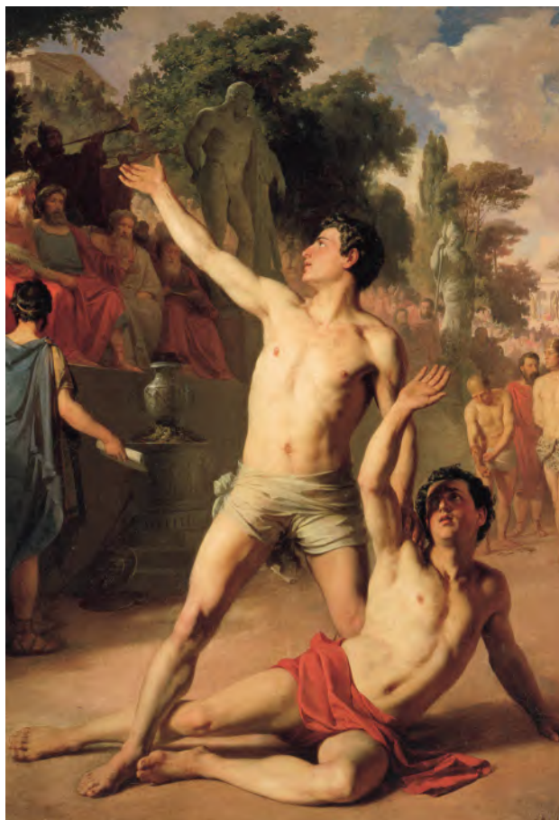
РИСУНОК 15 – Сцена из Олимпийских игр. Борьба. В. Верещагин. Киев, музей Русского искусства