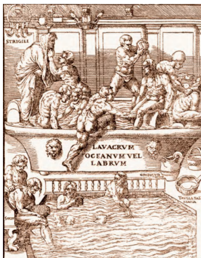
РИСУНОК 10 – Атлеты в плавательном бассейне. Литография из книги И. Меркуриалиса «Искусство гимнастики»

Это различие четко обозначено и в литературных произведениях других авторов. Например, американский писатель-романтик Эдгар По (1809–1849 гг.) четко различал культуру Древней Греции и Древнего Рима: «слава, которой была Гре-