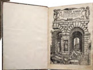
РИСУНОК 2 – Трактат об архитектуре Себастьяно Серлио