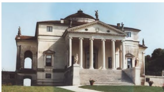
РИСУНОК 4 – Вилла Ротонда – первая светская постройка эпохи Возрождения, увенчанная куполом

искусстве, автор вышедшего в 1764 г. фундаментального труда «История античного искусства» (в некоторых изданиях название этой книги дается как «История искусства древности») (рис. 6). И. И. Винкельман видел в древнегреческом искусстве образцы правды, красоты, простоты и разума. Его призыв обновить современное искусство, пользуясь красотой античности, воспринимаемой как идеал, был озвучен следующими словами: «Единственный путь для нас стать великими, а если возможно, и неподражаемыми – это подражание древним». Он отмечал, что в основе прекрасного лежат верность пропорций, благородная простота, спокойное величие и плавная гармоничность контуров. Такая красота, по