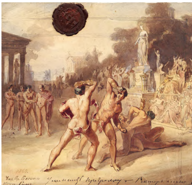
РИСУНОК 14 – Олимпийские игры. Гун Карл. 1860 г. Рига, Национальный художественный музей