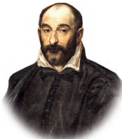
РИСУНОК 3 – Андреа Палладио – выдающийся архитектор позднего Возрождения, основоположник классицизма. На примере простых и изящных построек продемонстрировал, как достижения античности и высокого Возрождения могут быть творчески переработаны и использованы. Ему удалось сделать классический стиль архитектуры общедоступным и универсальным

В Германии от форм рококо, отмеченных римским влиянием, был сделан крутой поворот в сторону греческих форм. Это особенно заметно в таком архитектурном сооружении как Бранденбургские ворота в Берлине, строительство которых завершилось в 1791 г. (рис. 5). Интенсивное развитие неоклассицизма началось в этой стране после революции 1848–1849 гг. Стремление к благород-