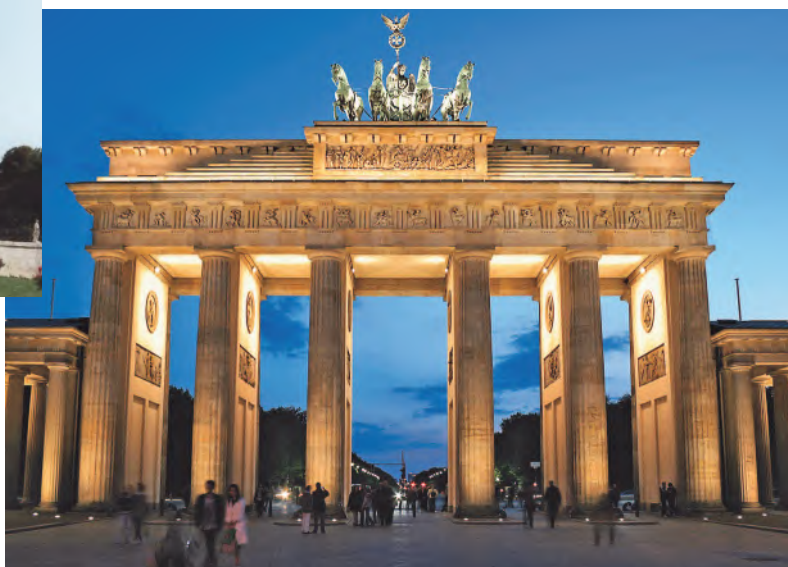
РИСУНОК 5 – Бранденбургские ворота – символ Германии, образец архитектуры классицизма (Лангганс Карл Готтгард, 1789–1791 гг.)