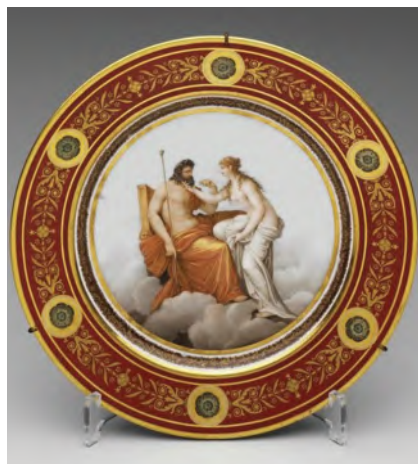
РИСУНОК 7 – Десертный фарфоровый сервиз «Олимпийский» выполнен на северских мануфактурах в 1803–1806 гг. Дар императора Наполеона I императору Александру I. Оружейная палата Московского Кремля