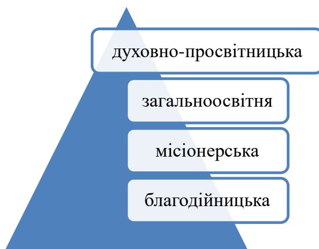
Рис.1.1. Основні місії релігійного туризму

До основних місій релігійного туризму можна віднести: духовно-просвітницьку, загальноосвітню, місіонерську, благодійну, що наведені на рисунку 1.1.