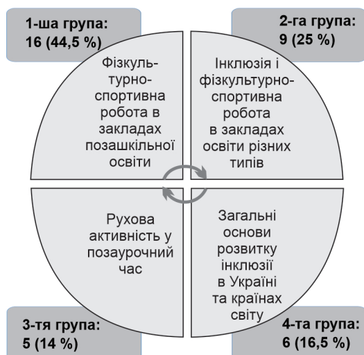
Рисунок 1 – Кількісний розподіл академічних текстів у змістових групах, відібраних для аналізу

дження організації фізкультурно-спортивної роботи в закладах позашкільної освіти. В 2014 р. таких досліджень було найбільше. Порівняно з попередніми роками в 2021 р. кількість захищених дисертацій збільшилася – три роботи.