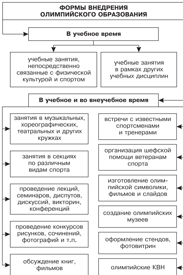
Рис. 2. Формы внедрения олимпийского образования

кую направленность. Ориентируясь на интересы, мотивы и потребности, эта система знаний призвана обеспечить целостное позитивное воздействие физкультурно-спортивной деятельности в интеграции с другими видами творческой работы на личность и человеческие отношения, что, в свою очередь, будет содействовать решению широкого круга педагогических задач применительно к различным социальным группам населения.