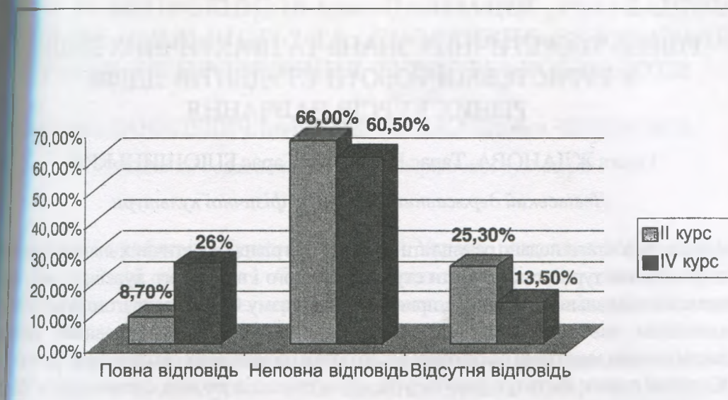
Рис. 2. Рівень засвоєння туристських вмінь студентів різних років навчання

не змогли дати відповіді на запропоновані питання теоретичного блоку тестів. Випускники спеціалізацій РОД і СОТ виявили кращі знання. Так, 24% студентів, вільно володіють матеріалом із запропонованих питань і дають повні відповіді. Дві третини старшокурсників (62,3%) дали відповіді на запропоновані тестові запитання, однак вони не були повними. Лише 13,7% учасників тестування не змогли відповісти на запропоновані запитання.