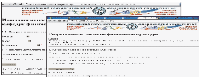
Рис. 3. Электронная оболочка для контроля теоретических знаний кафедры физического воспитания российского медицинского университета

неограниченное количество вопросов. Программа позволяет задать время для прохождения как одного вопроса, так и для всего теста и автоматически выставляет оценки по пятибальной шкале, внося их в журнал отметок (Пароль: "Тест").