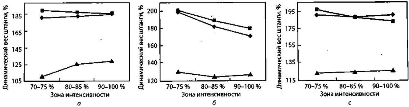
РИСУНОК 3 – Значения динамического веса штанги в подъеме от груди у тяжелоатлетов трех групп (А, Б, С) весовых категорий при разных величинах отягощений: ◆ – динамический вес штанги в фазе предварительного приседа ( F_{\text{опр}} ); ■ – динамический вес штанги в фазе посылы ( F_{\text{ос}} ); ▲ – динамический вес штанги в фазе порного приседа ( F_{\text{опр}} )

вых категорий, однако достоверные отличия получены только между тяжелоатлетами I и III групп – на 2,1 % ( p < 0,05 ).