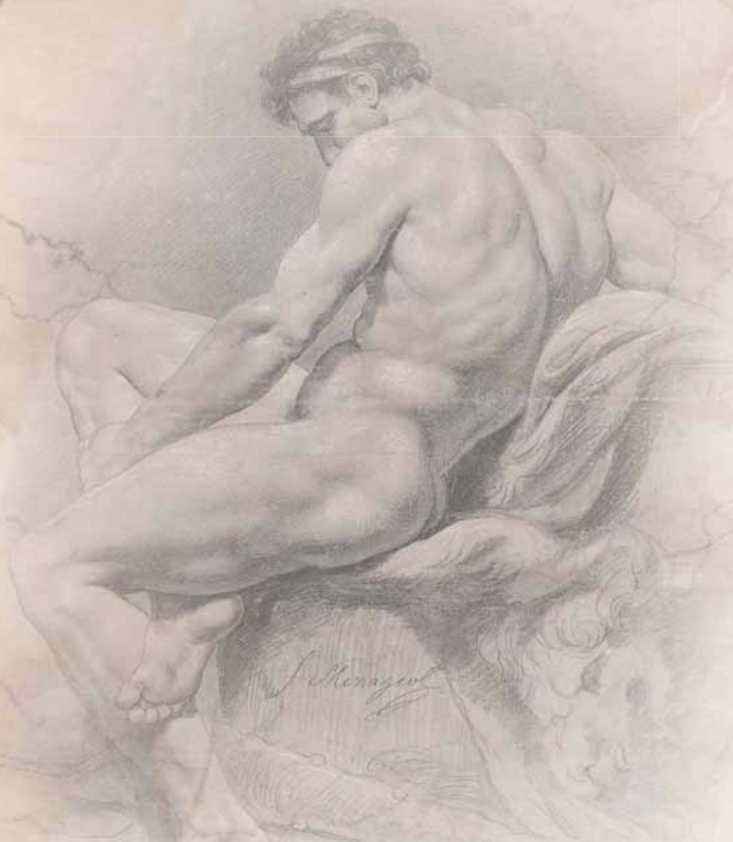
Геркл на отдыхе. Левый профиль. Франсуа-Гильем Менажо. XIX в.