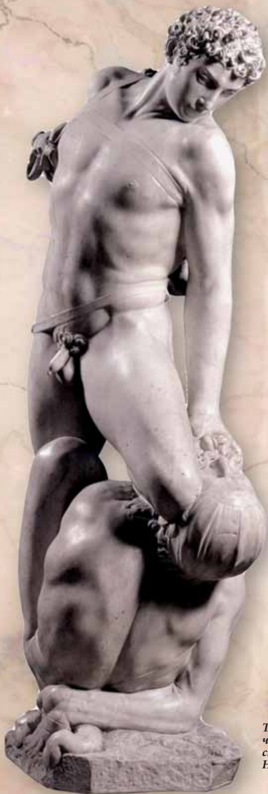
Триумфальная победа или торжество чести над любовью. Мраморная скульптура. 1561 г. Флоренция, Национальный музей Барджелло.

Однако интенсивное развитие борьба получила в XIX в., когда сначала в Англии, а затем в других европейских странах, стали проводиться соревнования в различных видах борьбы. Центрами расцвета борьбы становятся колледжи и университеты.