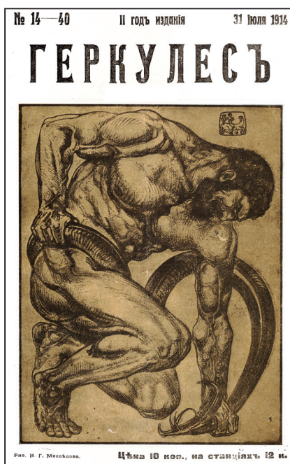
РИСУНОК 17 – Обложка журнала «Геркулес», освещавшего соревнования Второй Российской Олимпиады