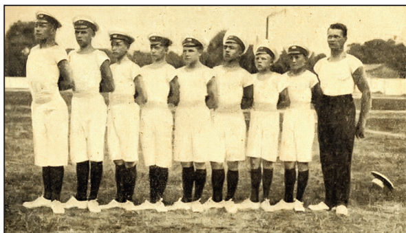
РИСУНОК 13 – Группа учеников Севастопольской мужской гимназии – участников Второй Российской Олимпиады