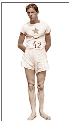
РИСУНОК 1 – Сильнейший спринтер России Василий Архипов – трехкратный чемпион Второй Российской Олимпиады