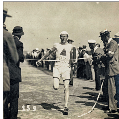
РИСУНОК 4 – На дистанции 5000 м финиширует Микко Стец

Наиболее представительными на Второй Российской Олимпиаде были соревнования по легкой атлетике, начавшиеся 6 июля и продолжавшиеся в течение пяти дней [13].