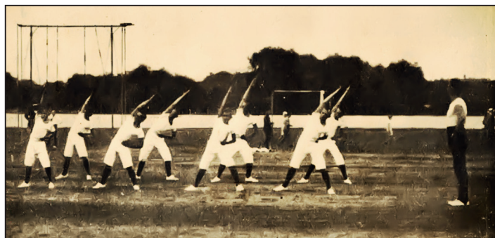
РИСУНОК 14 – Показательные гимнастические выступления учеников Севастопольской мужской гимназии