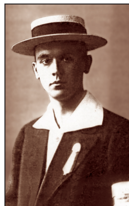
РИСУНОК 18 – Судья Второй Российской Олимпиады. На лацкане пиджака – знак для су- дей, на руке – судейская повязка с надписью: Вторая Российская Олимпиада, тяжелая атле- тика

стрелки Петербургского общества ревнителей военных знаний (1561 очко).