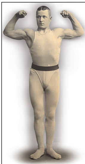
РИСУНОК 10 – Выдающийся борец Николай Лапчинский был одним из родо- начальников культуризма (в начале XX в. этот вид спорта назывался «красотой телосло- жения»)