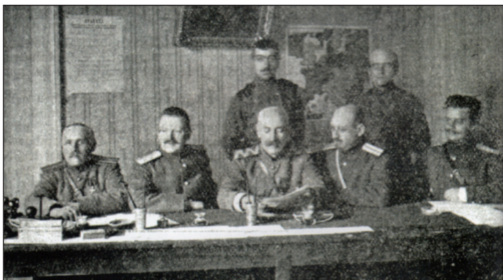
РИСУНОК 16 – Заседание рижской эва- куационной комиссии

левший дистанцию за 8 мин 32 с и опередив москвичей.